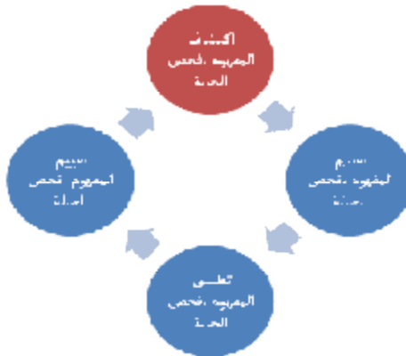
شكل مرقم (٤) يوضح نموذج دورة التعلم فوق المعرفية